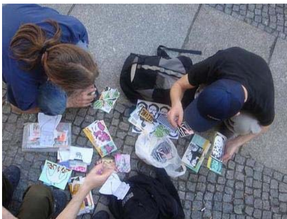
Intercambio de obxectos nas rúas de Berlín